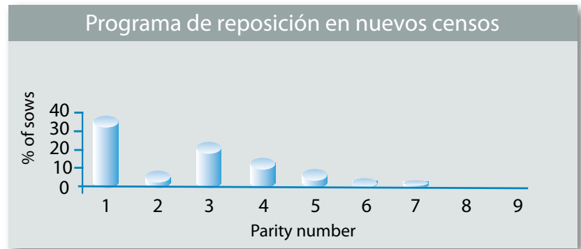
Gráfico 2. Programa de reposición en nuevos censos

La estructura censal no sólo influye enormemente en la productividad de nuestros animales, sino que también determina el promedio de camadas por vida productiva de cada cerda que podemos lograr. Ambos factores repercuten