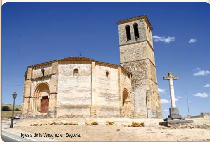
Iglesia de la Veracruz en Segovia.

Todos los participantes del XXX Simposium Anaporc disfrutaron de interesantes visitas guiadas a todos los famosos monumentos de Segovia: como el Alcazar, el acueducto romano... y, en especial, a una de las joyas monumentales más emblemáticas y únicas de la ciudad: la iglesia de la Veracruz, una obra arquitectónica del siglo XIII en la transición del románico al gótico. Según las explicaciones, su construcción se atribuye a los caballeros templarios, pero actualmente se considera que fue construida por la Orden del Santo Sepulcro. En su interior, los caballeros de la Orden de Malta, continúan actualmente con sus oficios, destacando la procesión del Viernes Santo.