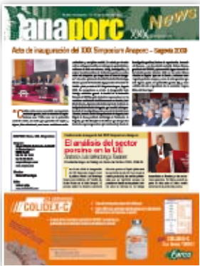
Durante el encuentro se distribuyó el periódico "Anaporc News XXX Simposium".

Tras la celebración de 29 ediciones del Simposium Anaporc, este acontecimiento anual de la porcicultura científica ha alcanzado en Segovia su plena madurez de planteamiento, organización, participación y desarrollo congresual, destacando su altísimo nivel científico, tanto en las ponencias presentadas como en la calidad académico-profesional de los especialistas nacionales e internacionales invitados; sus magníficas actividades sociales y culturales; la amplísima repercusión mediática (incluso se distribuyó por vez primera el periódico "Simposium Anaporc News" con la crónica y las imágenes de las actividades científicas y sociales desarrolladas en días anteriores) y por la incuestionable e inmejorable respuesta de la representación polí-