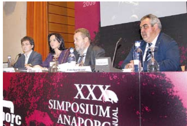
Mesa de clausura del Simposium.

que creemos que es una actividad económica de primer orden que aporta 140.000 empleos, y por ello también hemos decidido respaldar con líneas de préstamos las actividades del sector del porcino en Castilla y León. Ahora lo que tenemos que hacer es incidir aún más en la venta de nuestras producciones y llegar a todos los mercados. Sin duda la crisis pasará... y también debemos estar preparados”, concluyó.